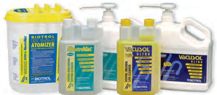
NeutraVAC est compatible avec les séparateurs d'amalgame.